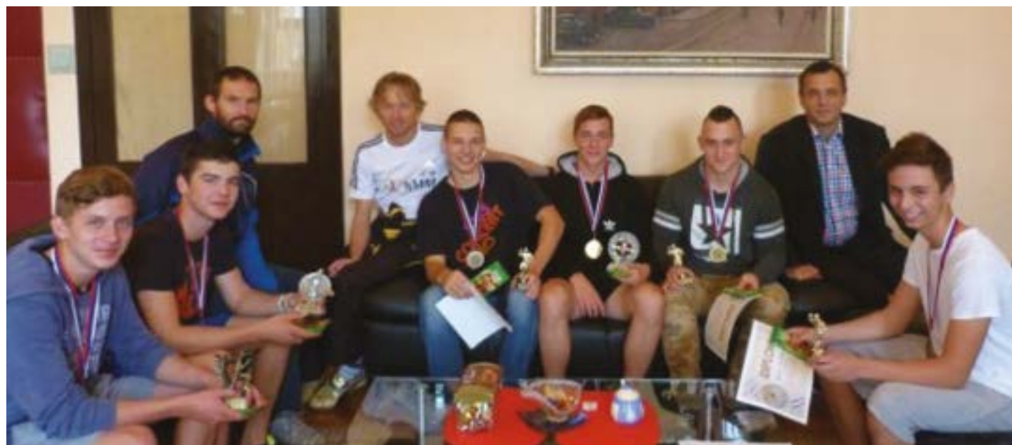
Pán riaditeľ, naši telocvikári a úspešní športovci v kancelárii pána riaditeľa