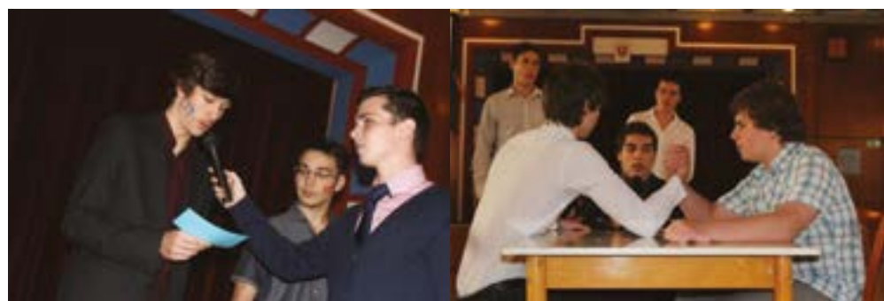
Súťažilo sa vo veľkom a každý chcel vyhrať

V druhej časti žiaci zložili slávnostný imatrikulačný sľub, ktorým vstúpili do radov elektrotechnikov. Nasledovala