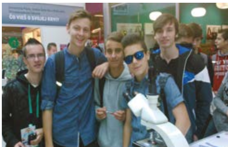
Žiaci 1.B triedy za cestou za poznáním

Dňa 26. 9. 2014 sa dve triedy 1. ročníka technického lýcea zúčastnili festivalu - Európska Noc výskumníkov. Naši študenti mohli vidieť tie najzaujímavejšie výsledky slovenskej vedy a osobnosti, ktoré sa vďaka svojmu výskumu presadili aj za hranicami nášho štátu.