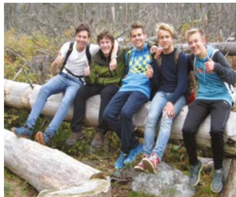
Vo Vysokých Tatrách

Nemeckí študenti na Slovensku od 3. - 13.10.2014 v Košiciach